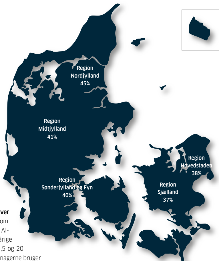
Figur 2. Personer, der har udført frivilligt arbejde det seneste år fordelt efter region. Procent. (Danmarkskort der viser de forskellige procenter.