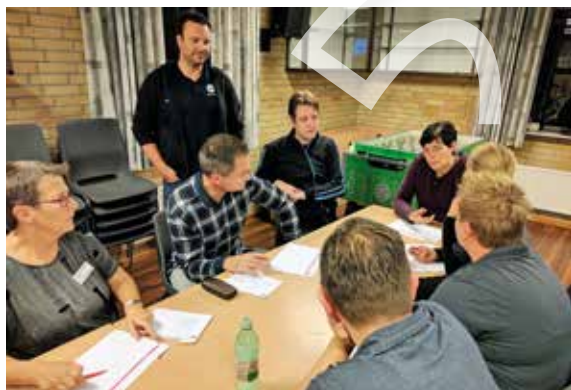
Snakken hos B73 Slagelse er i fuld gang - hvordan rekrutterer vi flere frivillige, var et af de store spørgsmål