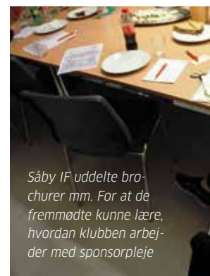
Säby IF uddelte brochurer mm. For at de fremmødte kunne lære, hvordan klubben arbejder med sponsorleje