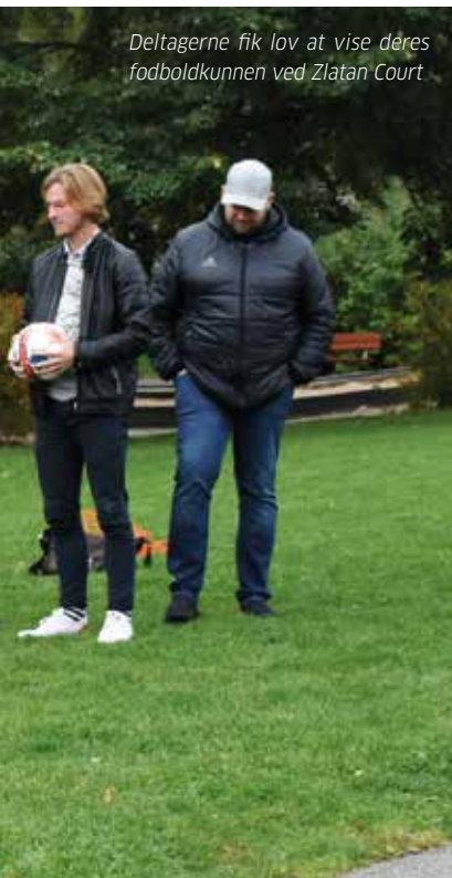
Deltagerne fik lov at vise deres fodboldkunnen ved Zlatan Court