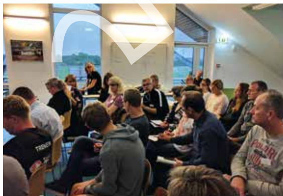
Mange var mødt op i Allerød mandag aften, hvor deltagerne hurtigt kom i dialog om måder at styrke frivilligheden på.

hvordan Taastrup FC har gjort sig tiltag for at skabe en synlig bestyrelse, hvilket understøtter og motiverer de frivillige. Ligeledes fortæller Melby-Liseleje IF om, hvordan de lykkes med at skabe stor opbakning til generalforsamlingen med godt 100 deltagende, Frederikssund Idrætsklub fortæller om, hvordan inklusionen af 60+ mænd og kvinder i klubben, har mundet ud i cirka 50 nye frivillige til klubben med flere.