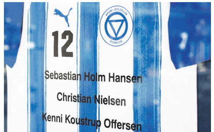
NÅR SORGEN RAMMER 33