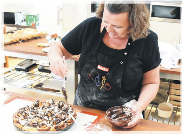
KAGEKONENS FODBOLDBAGERI 16